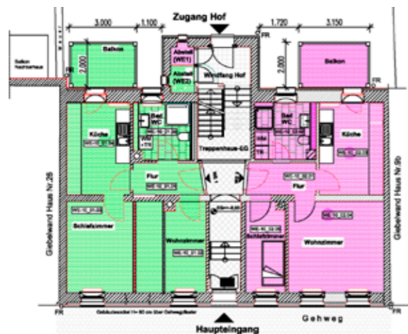
Grundriss 1. Obergeschoss

mie auf den Dachflächen. Im Hofbereich wurde bereits in den vergangenen Jahren eine großflächige Stellplatzanlage mit ausreichend PKW-Stellflächen geschaffen, welche über eine Einfahrt eines Nachbargebäudes der SWG zu erreichen ist.