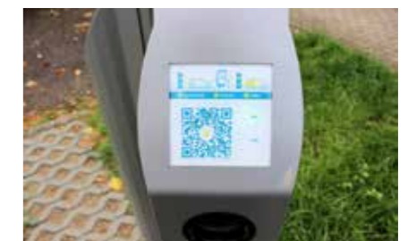
Einfaches Laden per App